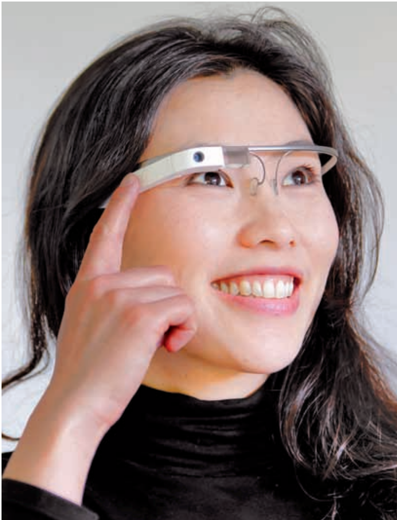
Radikale Innovationen, um neue Märkte zu schaffen: Computerbrille Google Glass.

Der Ruf nach mehr Selbstorganisation von Teams, Entscheidungsfreudigkeit von Mitarbeitern und höherer Transparenz in Unternehmensdaten kommt aus mehreren Richtungen. Da ist zum einen der demografische Wandel, der unsere Denkstrukturen zum Thema Arbeitsmarkt und Mitarbeiter herausfordert. Der Markt der Arbeitnehmer hat nun mehr Überraschungen für uns alle parat. Und wir tun uns schwer, ihnen erfolgreich zu begegnen. Da rätselt eine ganze Branche, wie man denn nun die Generation Y gewinnt und hält. Da werden Start-up-Konzepte in Konzernen umgesetzt, Employer Branding ist hoch im Kurs. Und die Erkenntnis, dass viele anscheinend etablierte Dinge wie Karriereemodelle den neuen jungen Arbeitnehmern irgendwie auch, aber irgendwie auch nicht so wichtig sind, stellt HR-Verantwortliche vor Rätsel. Ältere Arbeitnehmer werden wieder wertvoll, da sie ja einen Teil der nicht mehr so zahlreich vorhandenen jungen Kräfte kompensieren können beziehungsweise müssen. Aber diese Zielgruppe ist auch nicht mehr so wie früher. Auch sie hat gelernt und stellt höhere Ansprüche an das Thema Unternehmenskultur. An einigen Stellen lassen sich leichte Orientierungslosigkeit und damit einhergehender Aktionismus feststellen.